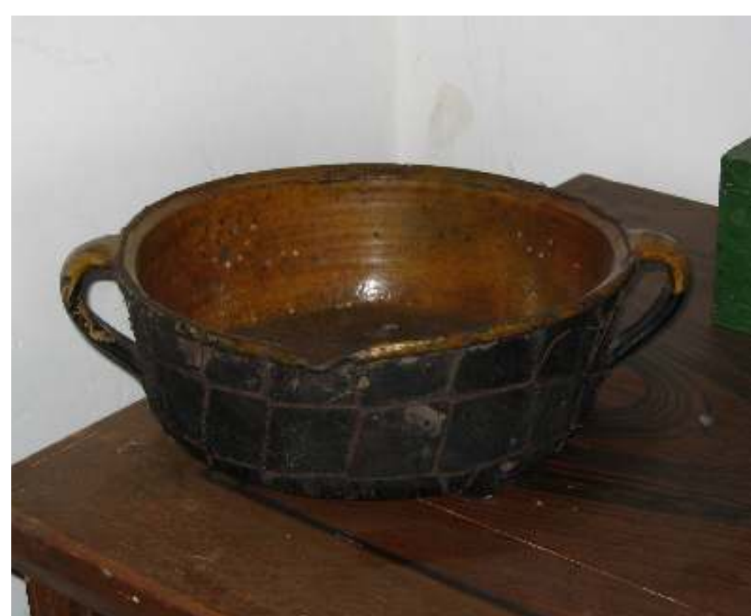
Posuda za kućanstvo s početka 20. stoljeća