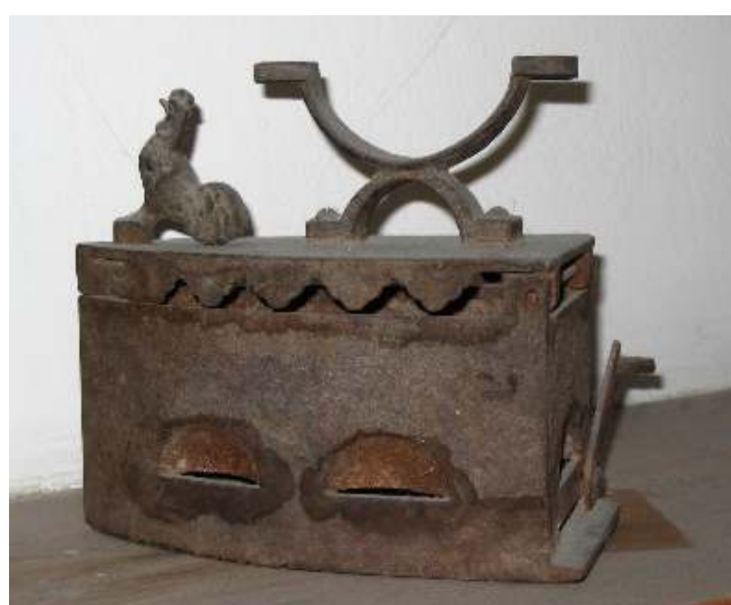
Željezno glačalo s kraja 19. stoljeća