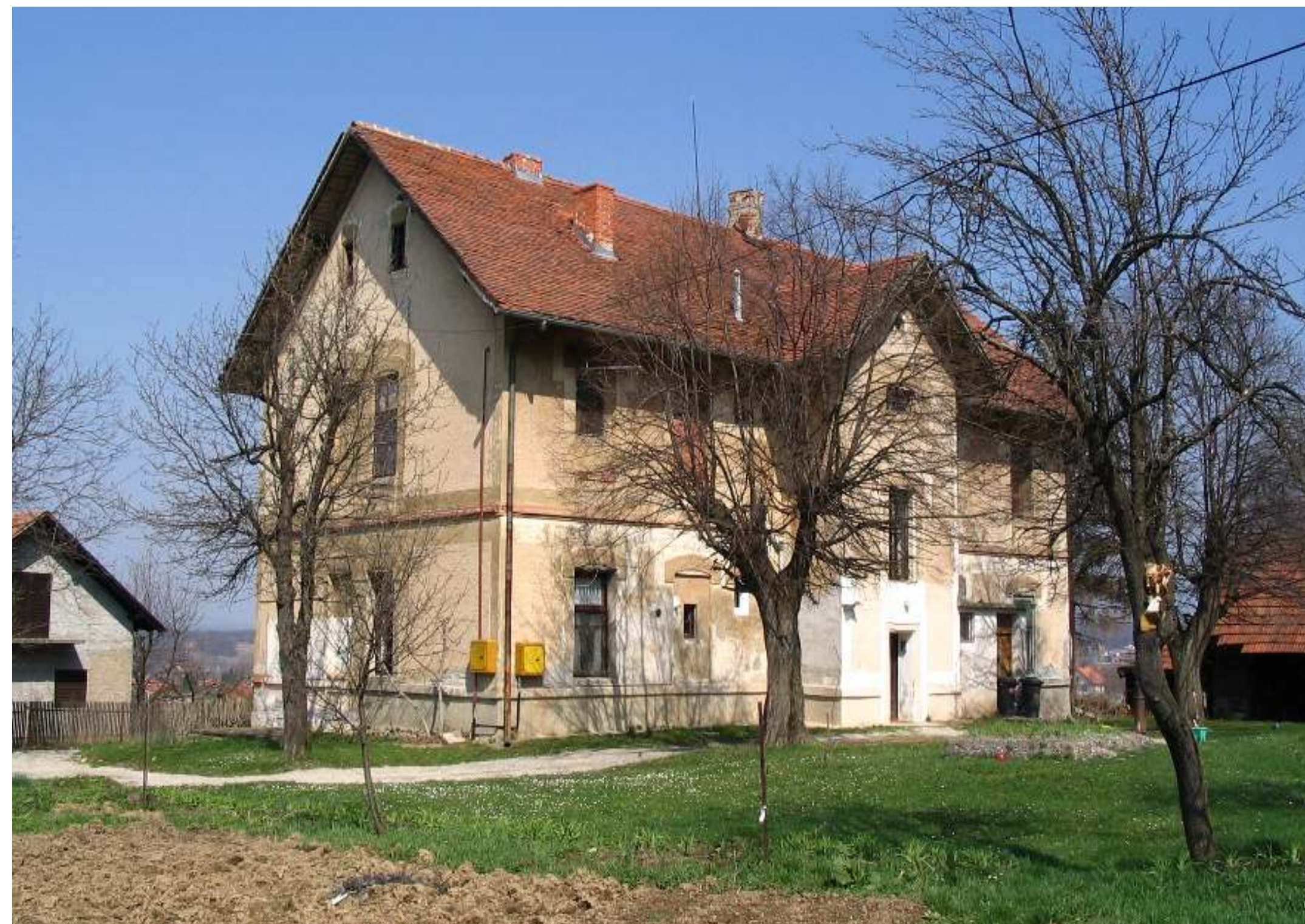
Fotografija Stare škole u Bistri iz 2016. godine