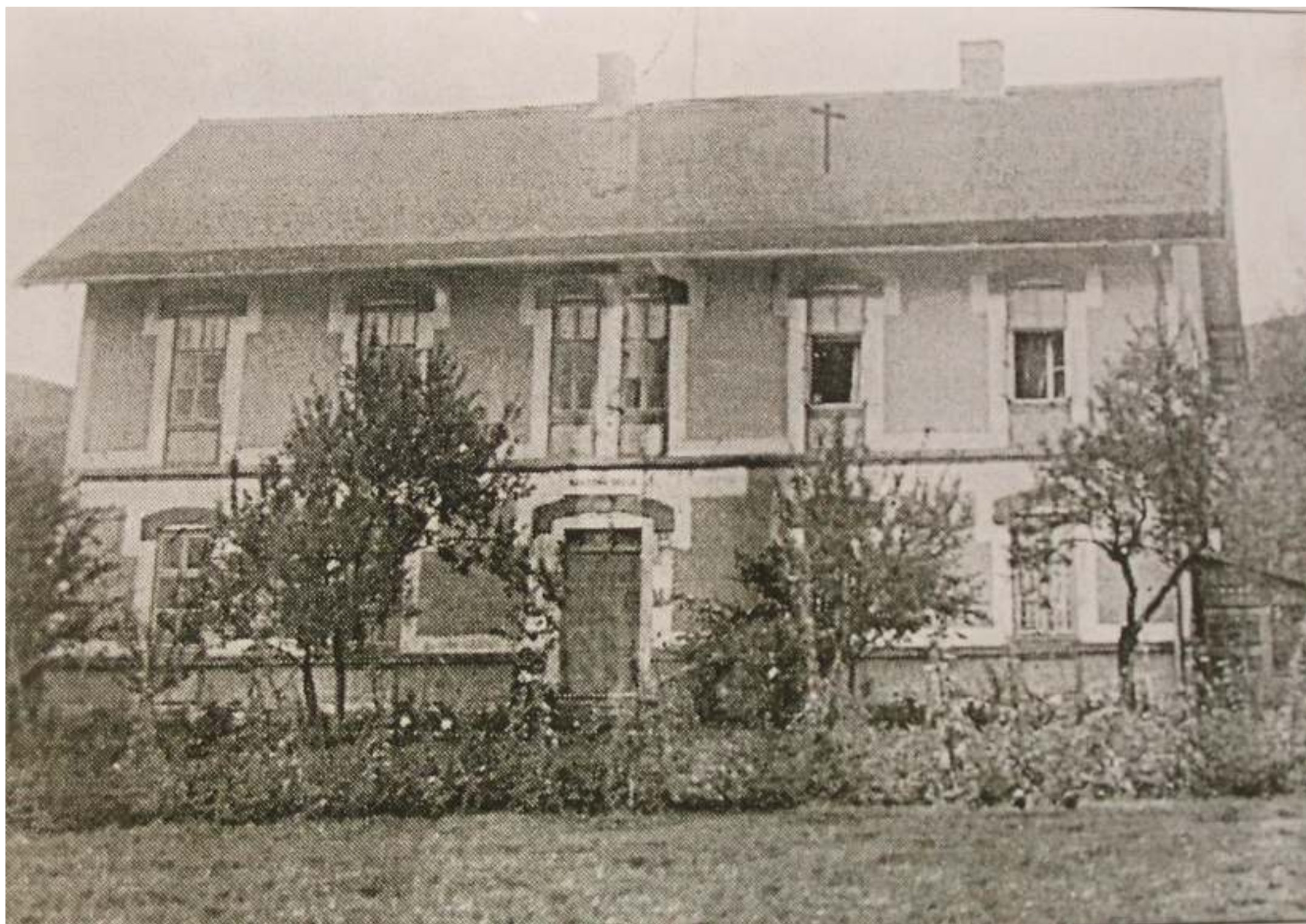
Fotografija Stare škole u Bistri nastala između 1946. i 1966. godine