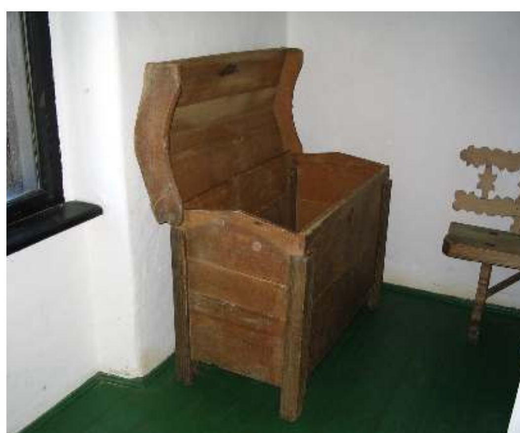
Škrinja s kraja 18. stoljeća