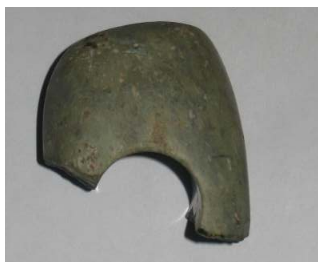
Ostatak kamenog čekića iz mlađeg kamenog doba