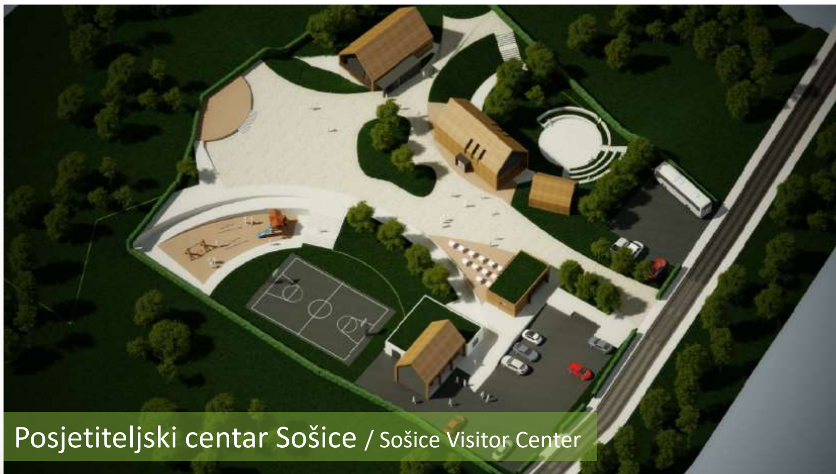
Posjetiteljski centar Sošice / Sošice Visitor Center