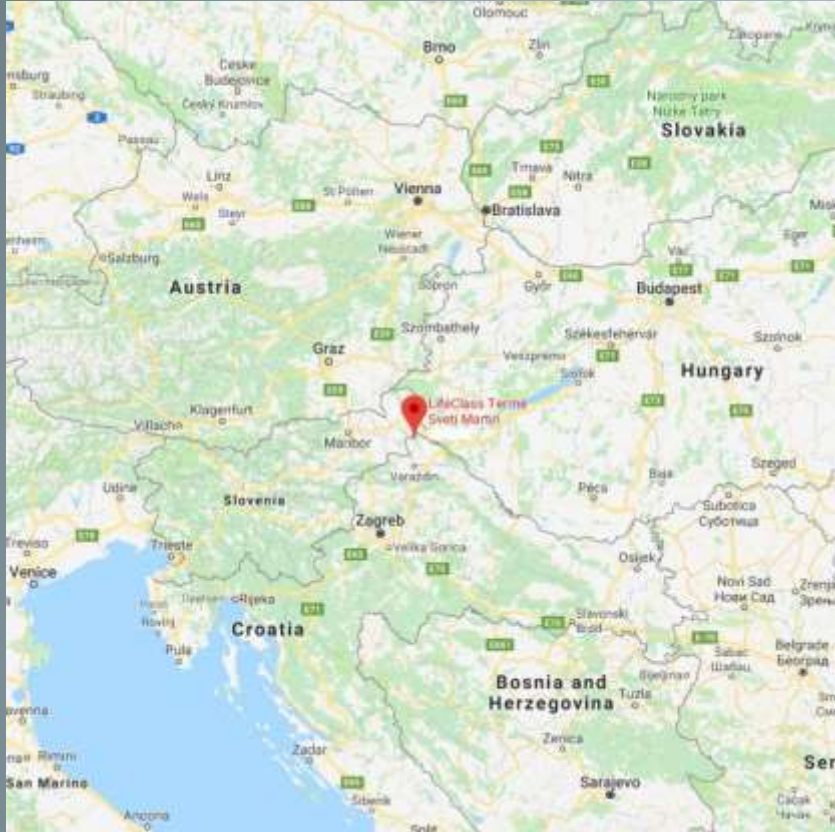
Geographical location of the Sv. Martin na Muri municipality