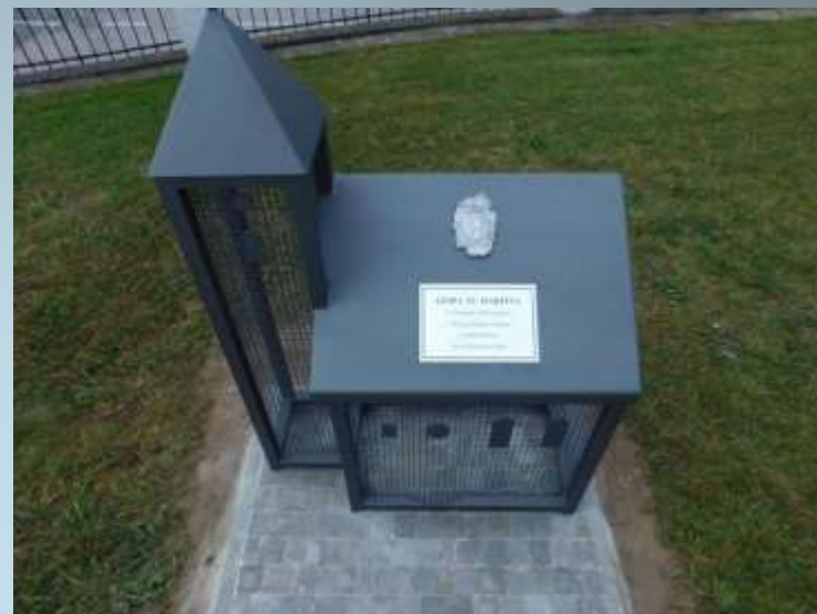
The Footprint of St. Martin plaque in Sv. Martin na Muri