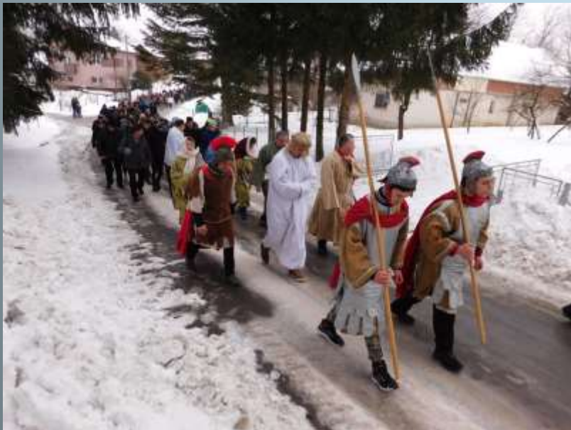
Good Friday's procession The Way of the Cross