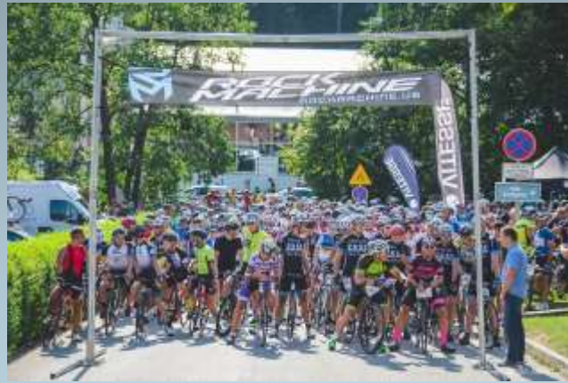
Cycling Pannonian marathon