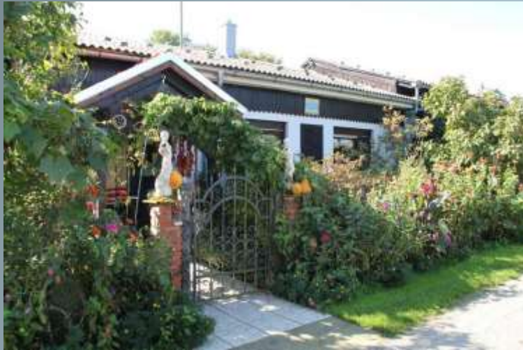
Private collection of ethnological items in the house of the Trstenjak family