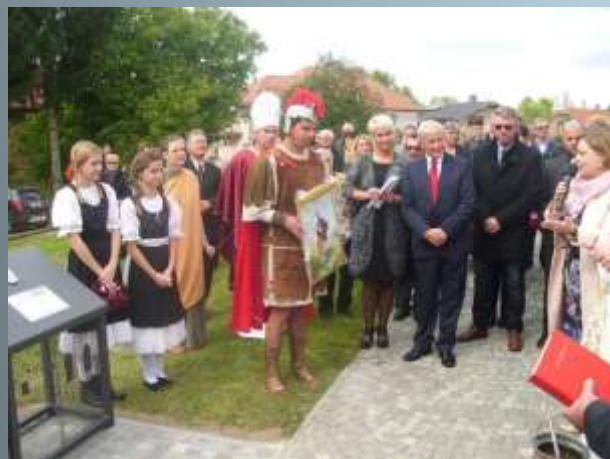
Blessing the Footprint of St. Martin plaque