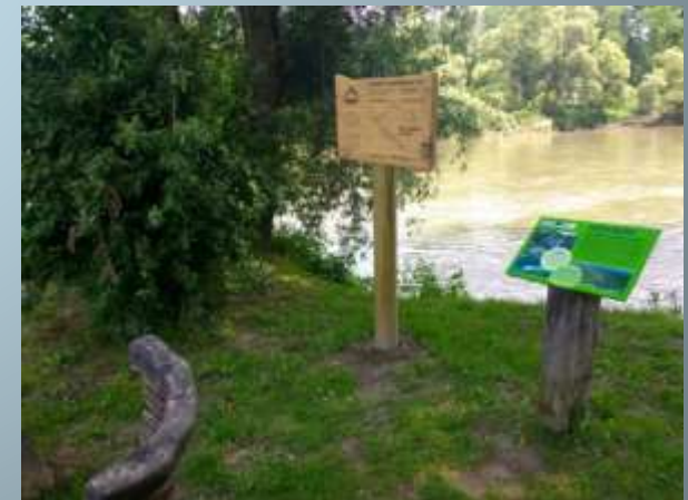
Walking trail along the Mura River