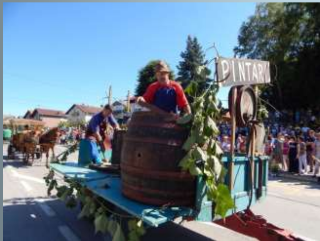
Parades of Old Crafts and Costumes