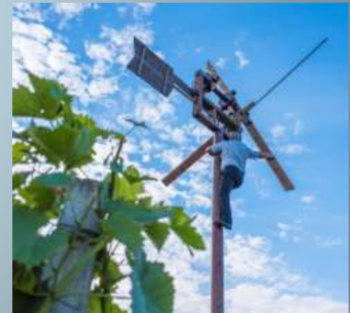
A wind-driven bird deterrent