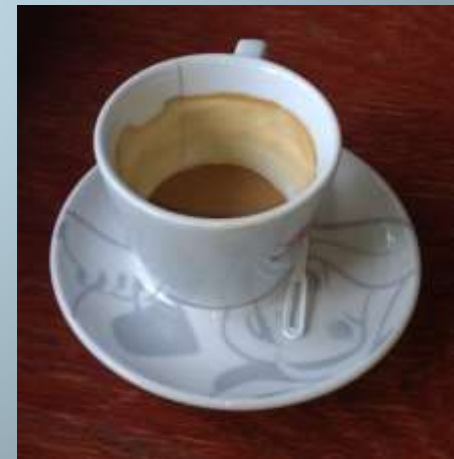
- plastic coffee spoons and scacked cups