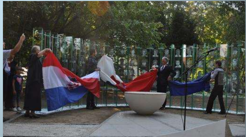
Commemorating the past