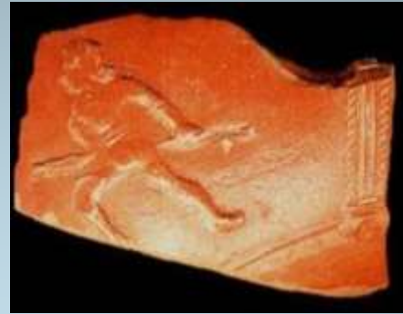
A fragment of Ancient Roman pottery