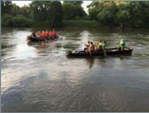
International rafting on the Mura River by the rowboats