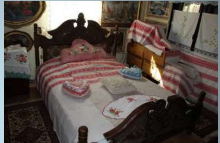
Traditional room in the village of Žabnik