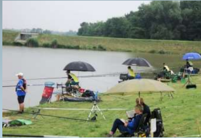
The World Fishing Tournament