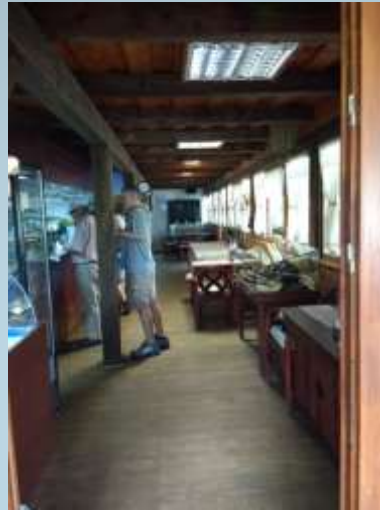
Information center for visitors