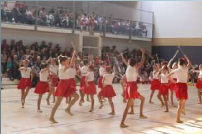
National Majorettes Festival