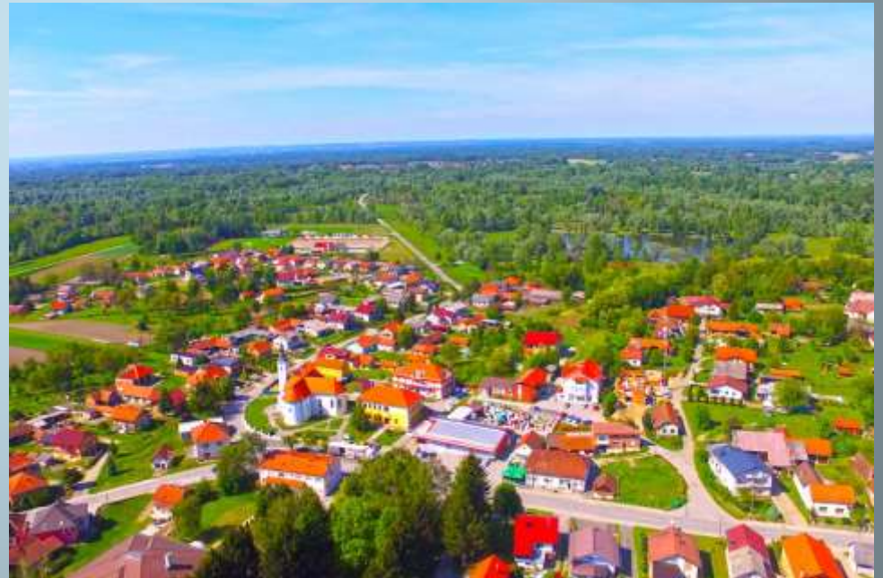
The village of Sv. Martin na Muri