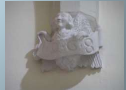
The oldest engraving of Arabic numerals (1468) in Croatia