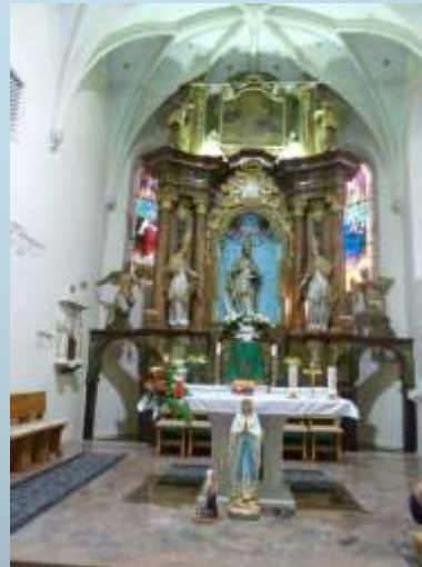
Gothic consoles and gothic-baroque altar