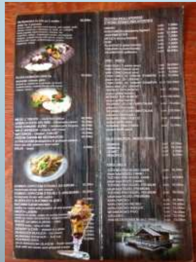
- threadbare menu