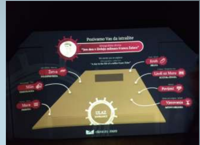
Digital multimedia-interactive ethno-collection