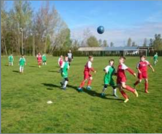
Local football tournaments