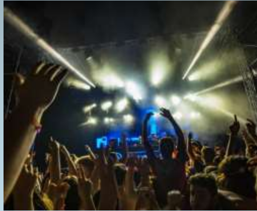
Electronic music party