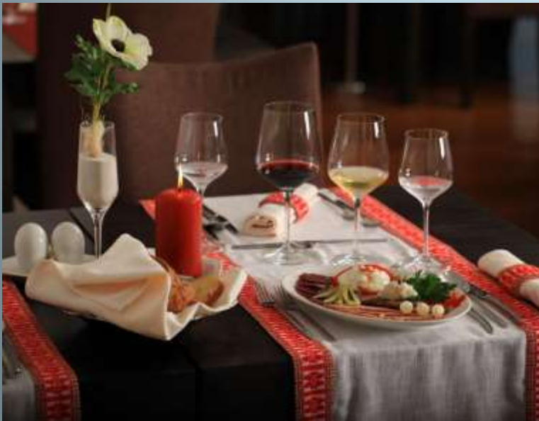
Traditional gastronomic-enological offer