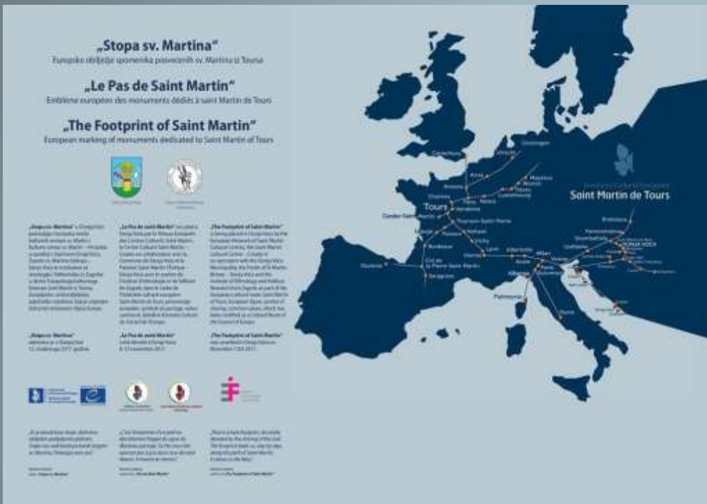
A map of The Footprint of Saint Martin