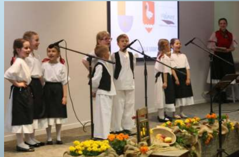
Medimurje Song Festival