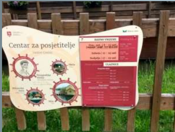
Parts of The Mura Ecomuseum

(Funded from the operational plan IPA SI – HR 2007-2013)