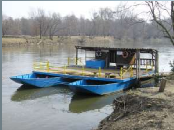
Traditional ferryboat and reconstructed mill on the Mura River