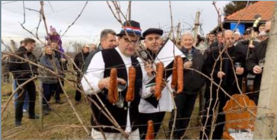
Traditional blessing of vineyards on St. Vincent's Day