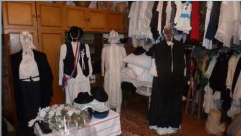
Traditional clothes of the Croatian Medimurje County