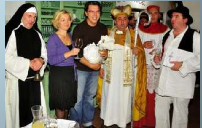
Folk blessing of wine on St. Martin's Day