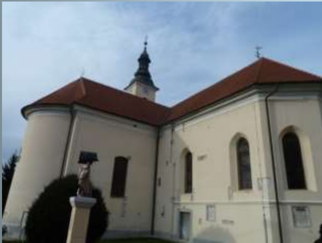
Gothic-baroque parish church of St. Martin