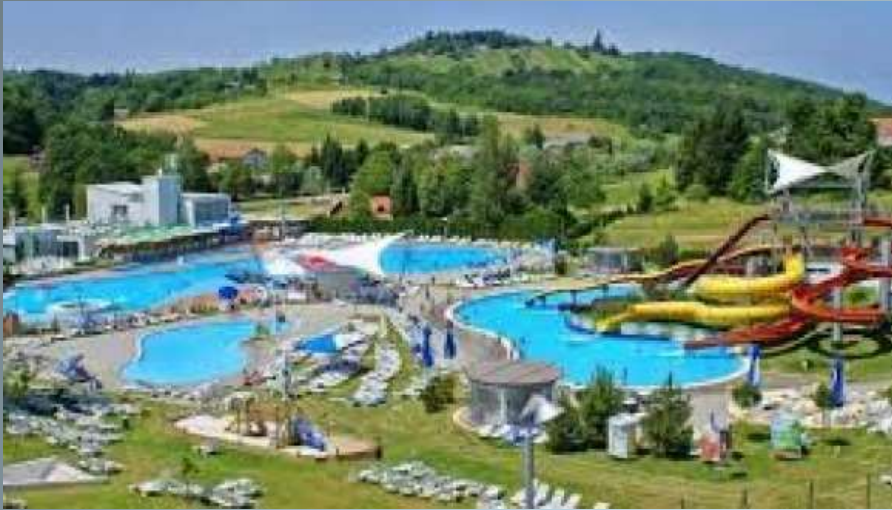
The Sv. Martin Spa built at the site of an Ancient Roman thermae