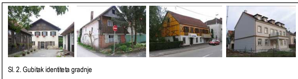
Sl. 2. Gubitak identiteta gradnje

Analize stanja na terenu potvrđuju da su na osnovi spomenutih planova neke povijesne građevine zamijenjene novima, koje u pravilu narušavaju povijesnu kompoziciju naselja i ambijentalni sklad. Takav pristup ne može opravdati ni činjenica da tada nije postojao poseban dokument koji bi obvezivao na izradu konzervatorske podloge kao jedne od nužnih sektorskih studija za izradu prostorno-planske dokumentacije. 3 Sve to ukazuje na ignoriranja uloge konzervatora pri izradi planova 4 , što je naposljetku i dovelo do postupnog propadanja i nestajanja tradicijskoga graditeljstva, važnog obilježja identiteta širega područja i samoga Ivanić-Grada.