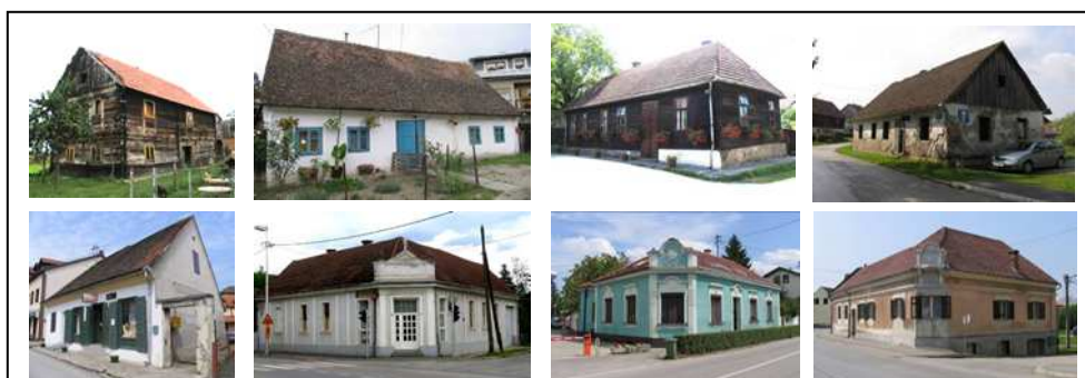
Sl.1. Tradicijski oblici gradnje – karakteristična obilježja identiteta naselja

očuvanju karakterističnih obilježja identiteta toga, nekad značajnog vojnog, obrtničkog i trgovačkog središta.