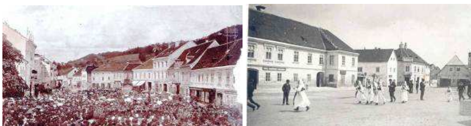
Slike 3. i 3.a Trg kralja Tomislava početkom 20.st.

Prepoznatljivosti Samobora doprinose, osim prostornih, fizičkih, estetskih i vizualnih obilježja, i njegove funkcije, sadržaji i ostala nematerijalna svojstva. Stari tradicijski i umjetnički obrti i zanati dio su bogatog povijesnog i kulturnog naslijeđa Samobora, a naročito oni vezani uz pogon vode riječice Gradne, ali i brojnih ostalih potoka u okolici. Radi se o tradicionalnim zanatima i obrtima mlinara, kožara, remenara, krznara te proizvodnji