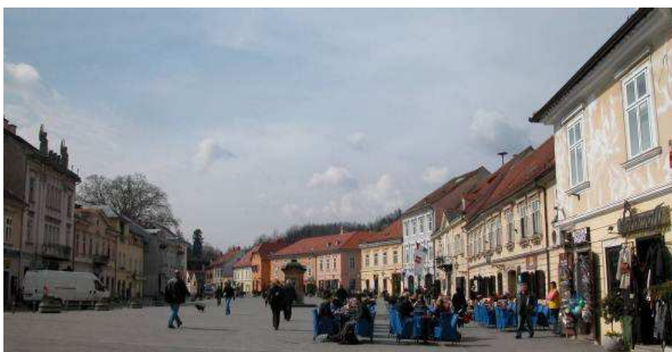
Slika 1. Trg kralja Tomislava

b) postojeći sustav organizacije, donošenja i provedbi odluka i planova o urbanoj obnovi; ulogu građana, javnog interesa te interesa pojedinih dionika (investitora).