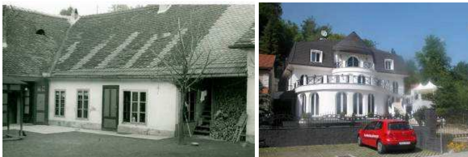
Slika 7. Karakteristični primjer tradicionalnog samoborskog dvorišta, sredinom 20.st. (Muzej Samobora)

Za svaki od navedenih planova, prostornog i urbanističkih, izrađene su konzervatorske podloge, koje su uključene u strukturu plana, poglavito u provedbene odredbe u kojima su dani potanki uvjeti za moguće zahvate na pojedinoj parceli i pripadajućim građevinama. S obzirom na propisanu strukturu sadržaja UPU-a, izuzev definiranja koridora ulica, plan ne ulazi u suštinske probleme prostora kojima je potrebna urbana obnova (društvene, demografske, gospodarske, financijske i sl.). Rezultat plana je provođenje njegovih odredbi koje se uglavnom temelje na ugrađenim uvjetima i smjericama konzervatorske zaštite danim prilikom izdavanja dokumenata za gradnju, rekonstrukciju ili prenamjenu.