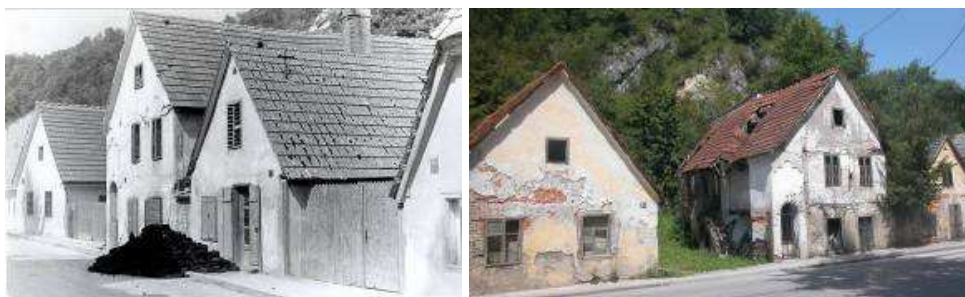
Slika 4. Starogradska ulica krajem 19. st. Slika 5. Starogradska ulica danas