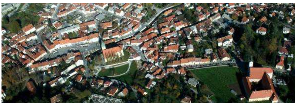
Slika 2. Panorama povijesne jezgre Samobora iz zraka (B.D. Bilušić, 2009.)

različite jezgre: stari grad i naselje Taborec te današnje gradsko središte, vezano uz Trg kralja Tomislava u podnožju župne crkve sa svojom nekadašnjom fortifikacijskom ulogom i prostor odvijanja javnog života grada - trgovine, sajmovi, sjedište magistrata, sud, škole, gostionice, hoteli i sl. Strukturna transformacija kojom je srednjovjekovni Samobor s pretežito drvenom, obrtničkom arhitekturom prerastao u današnji srednjoevropski gradić započela je potkraj 18. st. Karakteristike građevne strukture povijesnog Samobora određene su razdobljem intenzivne graditeljske aktivnosti 19. stoljeća. Ujednačenim mjerilom kuća, uglavnom jednokatne visine, karakterističnim volumenima zaključenim dvostrešnim krovovima, smještajem na parceli, elementima oblikovanja pročelja, slijedi se organičenost i mekoća formi srednjovjekovne urbane matrice. Pojedini objekti se funkcijom, volumenom ili oblikovanjem izdvajaju od karakterističnog mjerila i oblika građevne strukture grada te, kao akcenti i prostorni orijentiri, preuzimaju uloge simbola grada. Važne sastavnice prostornog identiteta i stvaranja njegovog doživljaja su sljedeća mjesta: stari samoborski grad, srednjovjekovna utvrda smještena na uzvisini iznad grada, tornjevi gradskih crkvi i kapela na istaknutim vrhovima okolnih brda.